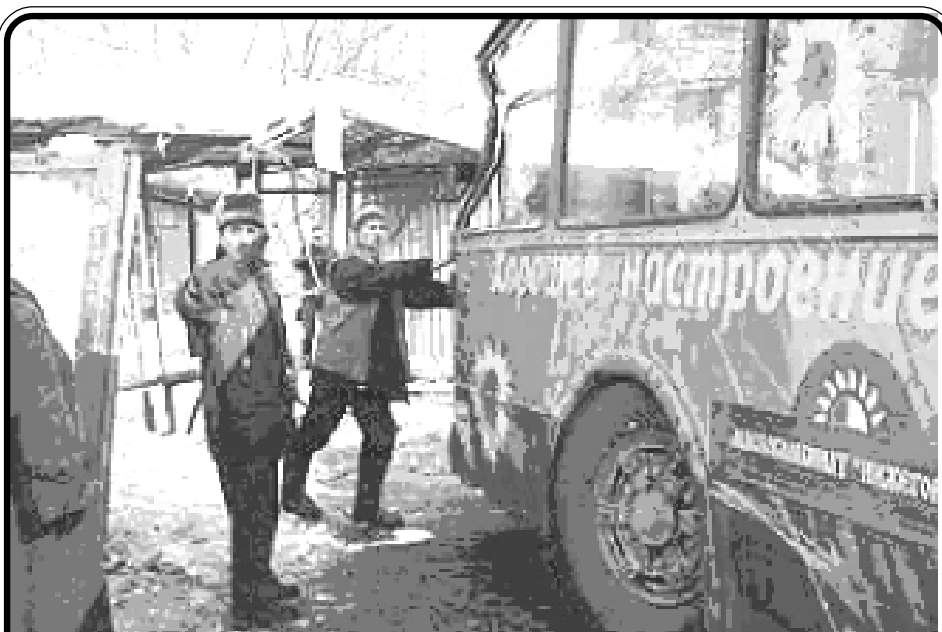
Фотография с места событий: разбитая остановка искореженная кабина троллейбуса.

Забавно. Пост только начался. То ли ещё будет.