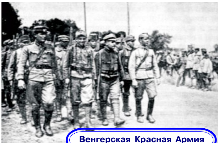
Венгерская Красная Армия

Красную Армию в общем порядке, и эту информацию уже достать невозможно, так как большинство документов Венгерской революции после ее поражения уничтожены, особенно военные, и тем более списки личного состава. Исходя из того, что к началу формирования Венгерской Красной Армии численность русских военнопленных в Венгрии была незначительна, а основное пополнение составляли транзитные эшелоны с на вербованными деникинским правительством бывшими военнопленными (каждый эшелон – около 20 вагонов по 40 человек итого 800 человек в каждом), Венгерская советская республика существовала только 133 дня, можно с уверенностью говорить, что доля русских военнопленных, защищавших Советскую Венгрию, от общего числа русских военнопленных в Венгрии сопоставима с долей военнопленных венгров, которые защищали Советскую власть в России. Об этом же