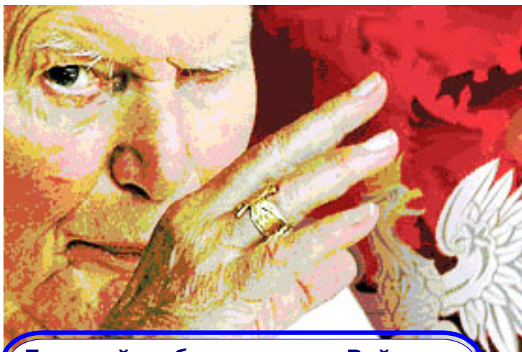
Большой любитель жизни Войтыла

п о с л е д н и х двух тысячелетий, счастье в сознании большинства землян отождествлялось не столько с полным бездельем, которое всегда было привилегией высшего духовенства и олигархов, сколько