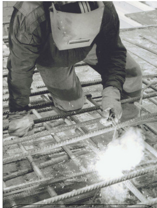
Фотографии Е.Квитко из серии «Гастарбайтеры». ( www.mdf.ru )