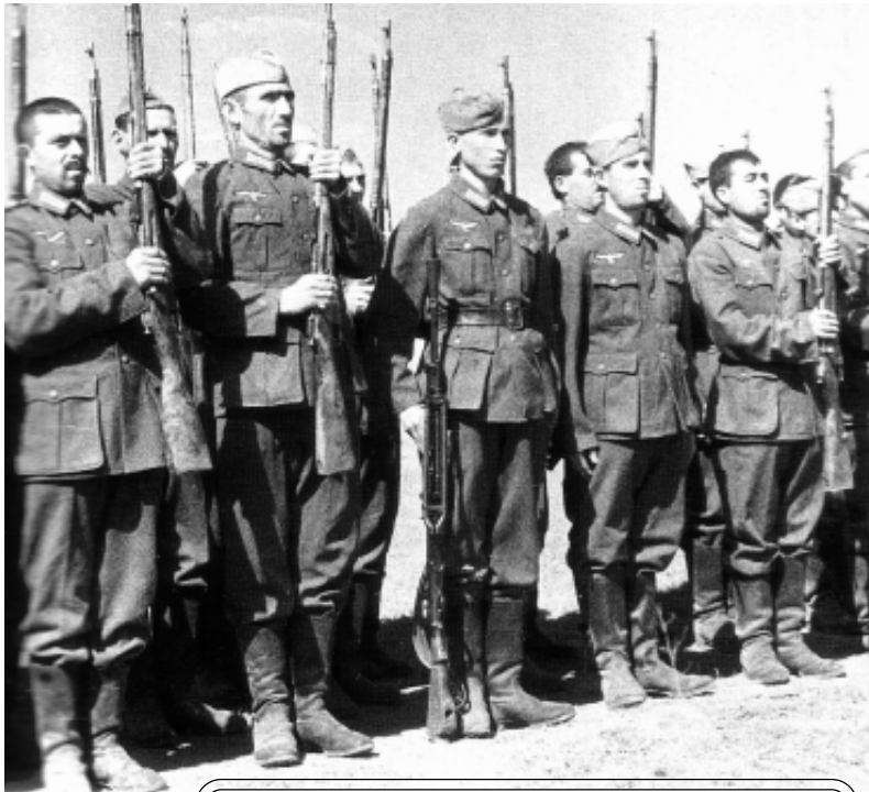
Фашистские формирования из крыских татар

Ещё более широко известен факт полного блокирования фашистами партизанского движения в Крыму специально созданными воинскими подразделениями из крымских татар при широкой поддержке татарского населения. Стоило появиться партизану, пытавшемуся раздобыть хотя бы глоток питьевой воды для раненых, как первая же встречная женщина или подросток сообщали о нём фашистам. В Аджимушкайских каменоломнях близ Керчи в мае - октябре 1942 героически оборонялись окруженные советские войска. 170 дней и ночей сражались воины подземного гарнизона. Предатели выдавали советских партизан, летом 1942 года фашисты расстреляли 2269 жителей и советских военнопленных. Не случай-