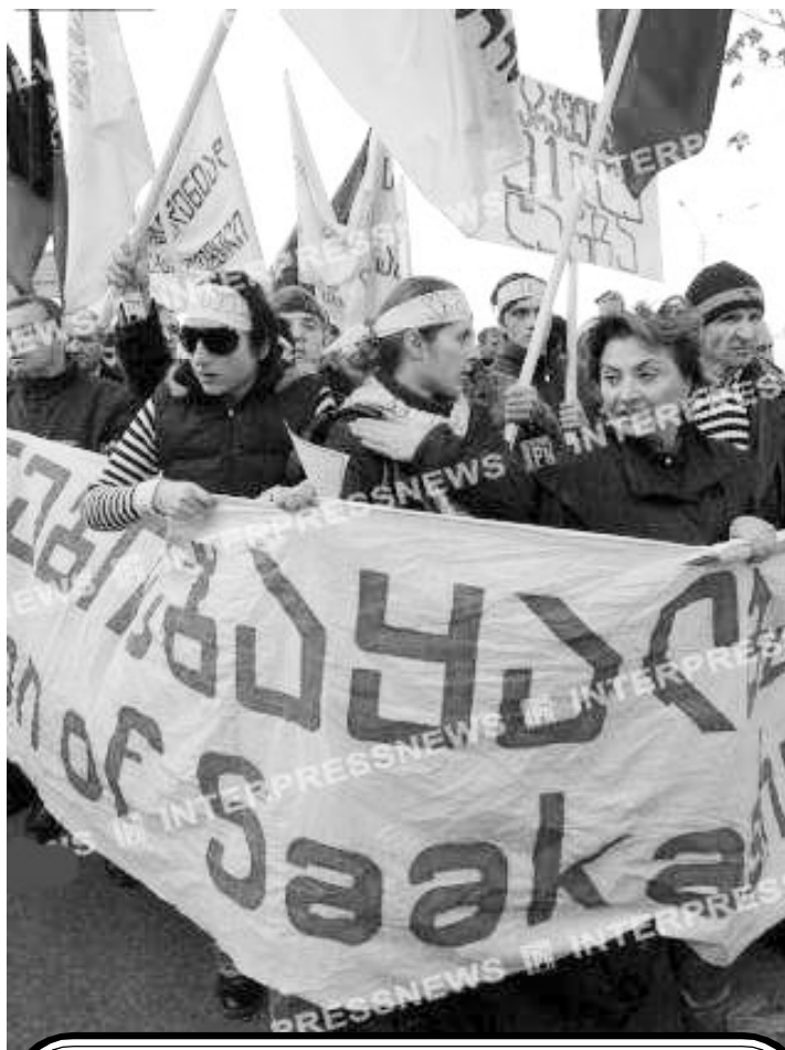
Лозунг манифестации – «Грузия без сфальсифицированных выборов и президента»

На Украине часть народа и политических деятелей уже пришли почти к подобному вы-