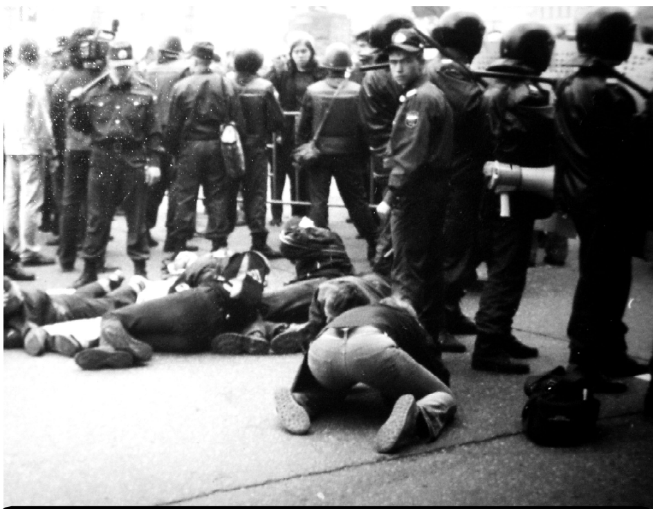
Типичное завершения митинга АКМовцами. Антикап 2002.

су – тут также как-то неоткуда было взяться особой принципиальности. Основное ядро АКМ – это молодые люди, в основном без определенного рода занятий, а зачастую студенты, а наиболее часто встречающийся тип – это молодой человек, который сидит на родительской шее, имитируя учебу или работу, а сам в тусовку, и митинговать, митинговать... Морально-этическое качество организации также оставляло желать