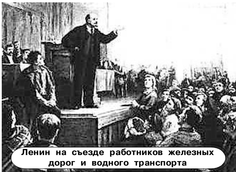
Ленин на съезде работников железных дорог и водного транспорта

Дело в том, что только классовое общество испытывает потребность в партийной организации политической жизни. Органичной чертой классового общества является усиленно культивируемое массовое невежество , в том числе, и невежество интеллигенции (аристократствующей, а потому и особенно гнилостной). Каждая преуспевающая партия, в том числе и коммунистическая, расширяясь, вынуждена расширять и аппарат управления. А рекрутировать партийных функционеров в КЛАССОВОМ ОБЩЕСТВЕ неоткуда, кроме как из среды дипломированных невежд, карьеристов и политических проходимцев типа Троцкого и Ельцина, Гайдара и Алексеевой, Новодворской и Яковлева.