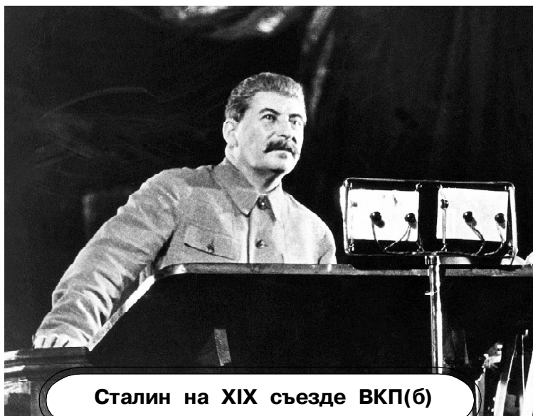
Сталин на XIX съезде ВКП(б)

цы пытались административным ресурсом запугать Подгузова и заставить его отказаться от выполнения важнейшей обязанности коммуниста: инициативно вести теоретическую борьбу, переигрывать оппортунистов, прежде всего, на поприще общественной теории. Борясь за вывод Подгузова из ЦК и МК, оппортунисты получали большое моральное удовольствие, надеясь, что, тем самым, раздавят человека морально и лишат его возможности работать на научном поприще. Они не понимали даже того, что наука это самая свободная сфера деятельности человека, что, освобождая Подгузова от текучки в ЦК и МК, они сняли с товарища очень утомительную организационную часть работы и позволили ему уделить больше внимания работе «Прорыва». Как и ожидалось, оппортунистическое большинство, изгнав «прорывцев» из руководства МК и редакции «Рабочей правды», завалило всю редакционно-издательскую работу.