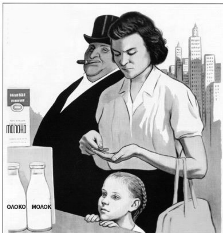
“ИЗОБИЛИЕ” ПРИ КАПИТАЛИЗМЕ - НЕДОСТУПНОСТЬ ПРОДУКТОВ БОЛЬШИНСТВУ НАСЕЛЕНИЯ

При капитализме не только реальное потребление рабочим классом средств существования ограничено, но даже для роста его потребностей существует