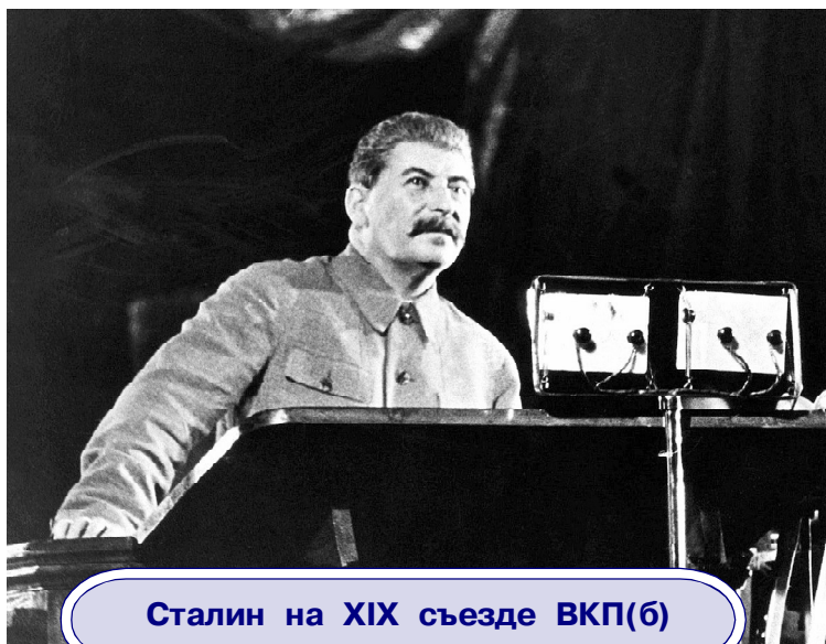
Сталин на XIX съезде ВКП(б)

цы пытались административным ресурсом запугать Подгузова и заставить его отказаться от выполнения важнейшей обязанности коммуниста: инициативно вести теоретическую борьбу, переигрывать оппортунистов, прежде всего, на поприще общественной теории. Борясь за вывод Подгузова из ЦК и МК, оппортунисты получали большое моральное удовольствие, надеясь, что, тем самым, раздавят человека морально и лишат его возможности работать на научном поприще. Они не понимали даже того, что наука это самая свободная сфера деятельности человека, что, освобождая Подгузова от текучки в ЦК и МК, они сняли с товарища очень утомительную организационную часть работы и позволили ему уделить больше внимания работе «Прорыва». Как и ожидалось, оппортунистическое большинство, изгнав «прорывцев» из руководства МК и редакции «Рабочей правды», завалило всю редакционно-издательскую работу.