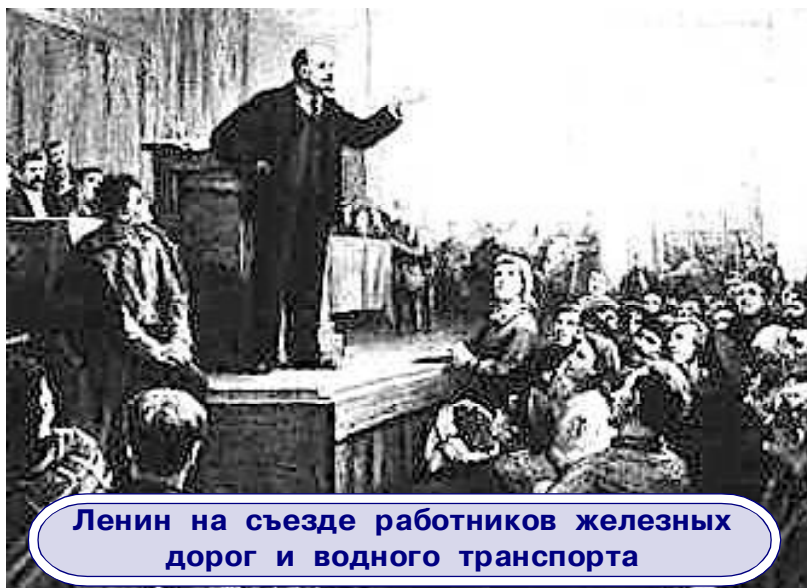
Ленин на съезде работников железных дорог и водного транспорта