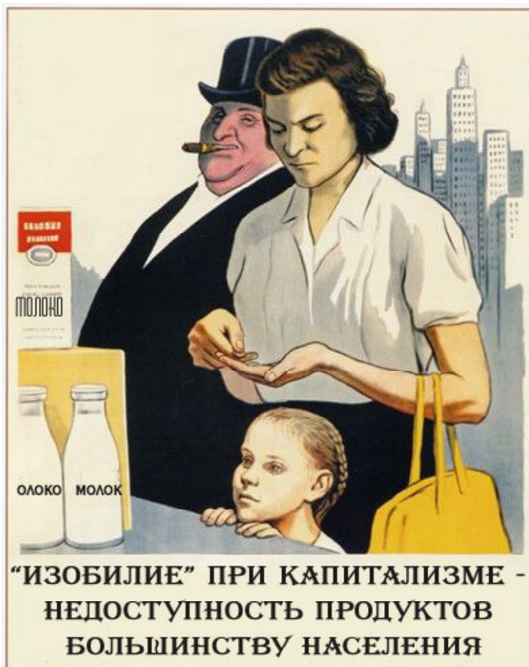
“ИЗОБИЛИЕ” ПРИ КАПИТАЛИЗМЕ - НЕДОСТУПНОСТЬ ПРОДУКТОВ БОЛЬШИНСТВУ НАСЕЛЕНИЯ

граница. Ибо применительно к наемному рабочему речь идет не о каких-то абстрактных потребностях, не о потребностях вообще и, уж конечно, не о неких сверхпотребностях, а только о тех из них, удовлетворение которых безусловно необходимо для нормального воспроизводства рабочей силы. Таково объективное положение пролетария в буржуазном обществе. Нельзя забывать и о непрерывном росте цен. А также о страхе перед безработицей, когда рабочий из страха стать безработным не позволяет себе расходовать всю зарплату и вынуж-