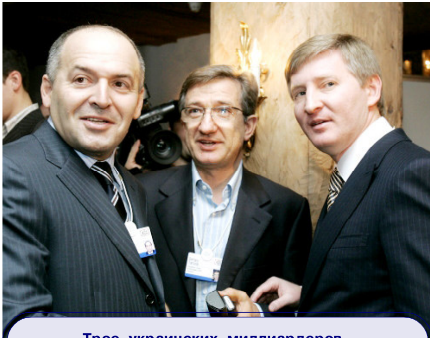
Трое украинских миллиардеров - Виктор Пинчук, Сергей Тарута и Ринат Ахметов

верят даже в такой абсурд, что их эксплуатация и ограбление осуществляются ради их же блага. Если вернуться к нашим миллиардерам, то буржуазная «наука» предлагает нам смириться с их существованием и подождать. В присущей ей манере пере-