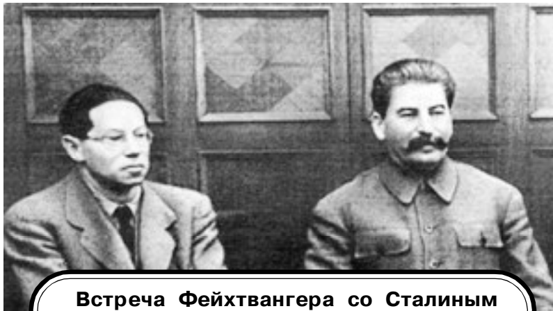
Встреча Фейхтвангера со Сталиным 8 января 1937 года

дение обвиняемых перед судом осталось для меня не совсем ясным. Немедленно после процесса я изложил кратко в советской прессе свои впечатления: «Основные причины того, что совершили обвиняемые, и главным об-