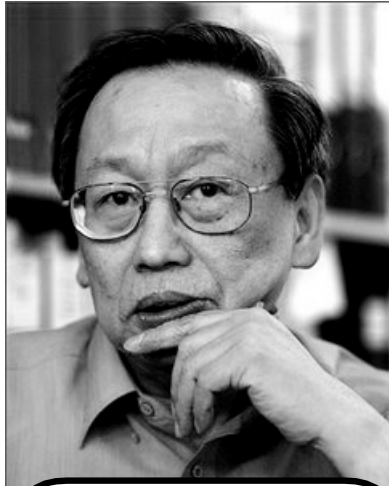
Хосе Мария Сисон

скрыть, что основной причиной кризиса является монополистический капитал и сделать козлом отпущения афро-американцев, иммигрантов и других людей, а также режим Обамы, действия которого усугубляют кризис. Но широкое социальное недовольство развивается и превращается в решительное и боевое сопротивление народа в самом центре мирового капитализма. Оно может привести к более воинственным выступлениям пролетариата и всего народа.