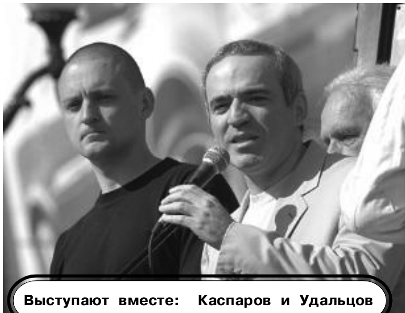
Выступают вместе: Каспаров и Удальцов

будут привлекать к себе, включать в общую организацию, подчинять общепролетарской дисциплине все пролетарские, полупролетарские, наименее пролетарские, даже наиболее мелкобуржуазные, слои трудящихся, которые поворачивают к рабочим. Тут