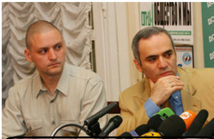
Выступают вместе: Каспаров и Удальцов

Исходя из уже имеющегося майданного опыта, можно выделить несколько правил поведения на этих и им подобных акциях. Прежде всего, выходить на них собственными, пусть и небольшими, коллективами, т.е. объединенной силой, чувствуя поддержку друг друга, буквально сорганизовавшись в отдельный отряд с избранными самими командирами. Во-вторых, в каждом