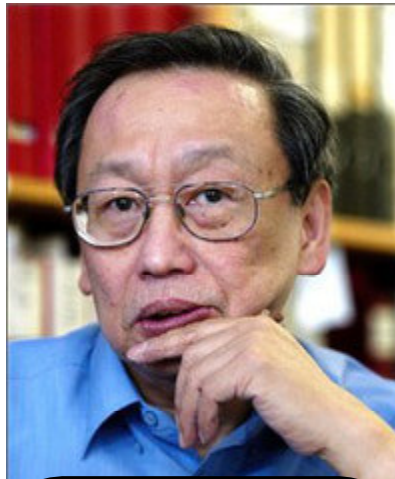
Хосе Мария Сисон

Быстрое углубление кризиса мировой капиталистической системы создаёт серьёзные трудности и приносит к страданиям людей во всём мире. В то же время это заставляет людей сопротивляться. Существует настоятельная необходимость усиления антиимпериалистической и демократической борьбы народа в глобальном масштабе. Существует так же, как указывает в своей книге Рэй О.Лэйт, настоятельная необходимость в руководящей роли революционной партии пролетариата в революционной массовой борьбе в различных странах и в укреплении международного коммунистического движения.