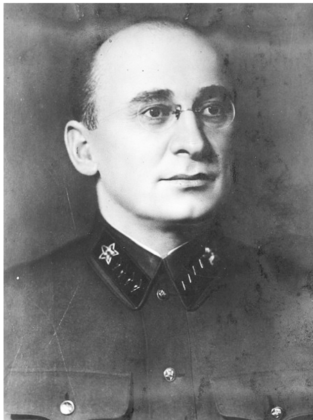
Лаврентий Павлович Берия, В ноябре 1940 г. Народный комиссар внутренних дел СССР, член Президиума Верховного совета СССР, кандидат в члены Политбюро ЦК ВКП (б)

За полтора года наркоматом снято с работы 26 руководителей предприятий и 18 главных инженеров. Только на заводе № 78 за это время в цехе № 4 было сменено 5 начальников, 8 заместителей начальников и 14 начальников отделений, а в цехе № 2 — 3 начальника, 5 помощников начальников и 3 старших технолога; на заводе № 9