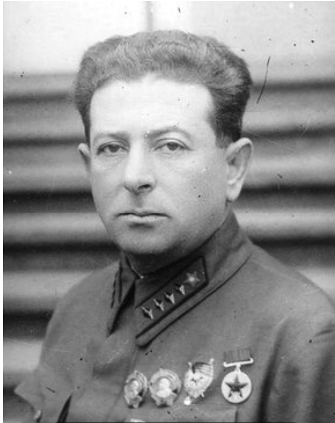
Лев Захарович Мехлис,

Многим из этих лиц не место в аппарате НКБ. Между тем в 1940 г. в порядке сокращения штатов из центрального аппарата удалено 171 член ВКП(б), 166 инженерно-технических работников. Само сокращение было всецело передоверено Иняшкину и начальникам главков.