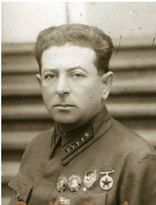
Лев Захарович Мехлис, В ноябре 1940 г. Народный комиссар государственного контроля СССР, Заместитель Председателя Совета Народных Комиссаров СССР, член Оргбюро ЦК ВКП(б)

В октябре 1940 года, будучи председателем комиссии по выявлению причин и виновников