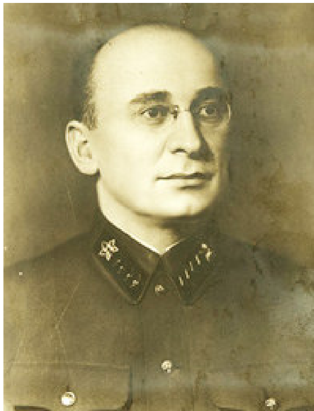
Лаврентий Павлович Берия, В ноябре 1940 г. Народный комиссар внутренних дел СССР, член Президиума Верховного совета СССР, кандидат в члены Политбюро ЦК ВКП (б)

За полтора года наркоматом снято с работы 26 руководителей предприятий и 18 главных инженеров. Только на заводе № 78 за это время в цехе № 4 было сменено 5 начальников, 8 замес-