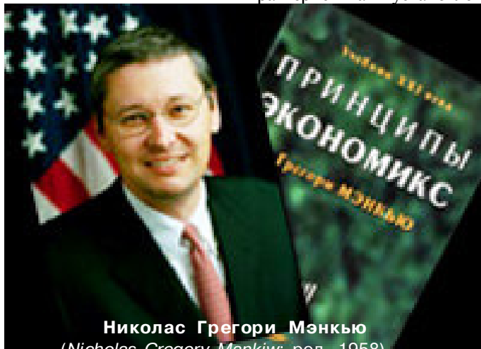
Николас Грегори Мэнкью

По общему правилу, все качественно отличные друг от друга экономические процессы тоже имеют количественную определенность. Следовательно,