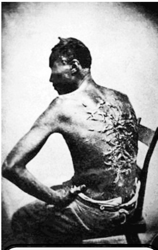
Чернокожий раб выжил после наказания. США, Луизиана, 1863 год

ва одностороннего разрыва со стороны работника. При капитализме это не противостоит, это закономерная часть его - когда кладешь плитку на стену, всегда приходится часть плитки подрезать, чтобы по размеру подошла. Вот локальные случаи рабства - это такой «обрезанный» капитализм, абсолютно необходимый там, где условия игры на рынке не позволяют иначе иметь максимальную прибыль.