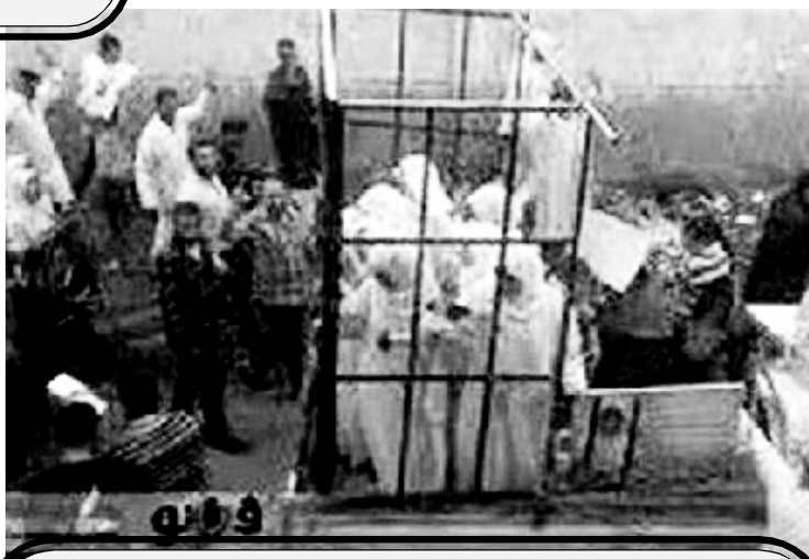
Современный невольничий рынок в Мосуле. Продажа рабынь «борцами с США» из ИГИЛ.

на заводе, но в Трансваале не было особых заводов, зато мотыгой надо было работать много - а для этого и раб сгодится. Неравномерность развития, ЗАКОНОМЕРНО сохраняющая область применимости рабства, создает объективную предпосылку для рабства. Работоторговцы из ИГИЛ 3 - это нормальные капиталисты, которые торгуют востребованным в хозяйстве товаром, а рабовладельцы - это такие же нормальные капиталисты, которые сумели максимизировать рабочий день до 24 часов в сутки и заключить бессрочный контракт без пра-