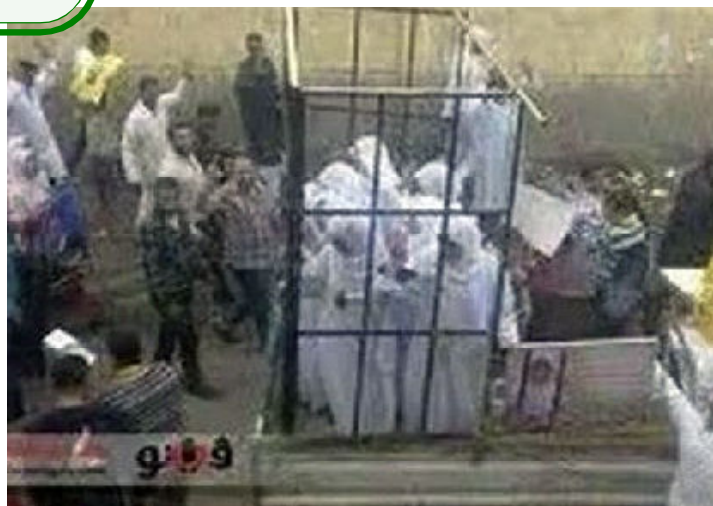
Современный невольничий рынок в Мосуле. Продажа рабынь «борцами с США» из ИГИЛ.

на заводе, но в Трансваале не было особых заводов, зато мотыгой надо было работать много - а для этого и раб сгодится. Неравномерность развития, ЗАКОНОМЕРНО сохраняющая область применимости рабства, создает объективную предпосылку для рабства. Работоторговцы из ИГИЛ 3 - это нормальные капиталисты, которые торгуют востребованным в хозяйстве товаром, а рабовладельцы - это такие же нормальные капиталисты, которые сумели максимизировать рабочий день до 24 часов в сутки и заключить бессрочный контракт без права одностороннего разрыва со стороны работника. При капитализме