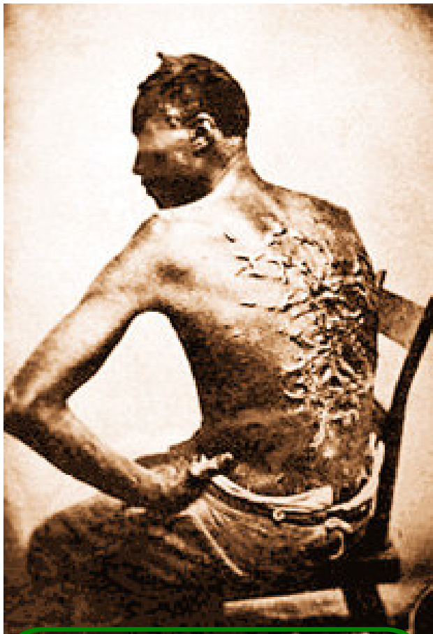
Чернокожий раб выжил после наказания. США, Луизиана, 1863 год

на заводе, но в Трансваале не было особых заводов, зато мотыгой надо было работать много - а для этого и раб сгодится. Неравномерность развития, ЗАКОНОМЕРНО сохраняющая область применимости рабства, создает объективную предпосылку для рабства. Работоторговцы из ИГИЛ 3 - это нормальные капиталисты, которые торгуют востребованным в хозяйстве товаром, а рабовладельцы - это такие же нормальные капиталисты, которые сумели максимизировать рабочий день до 24 часов в сутки и заключить бессрочный контракт без права одностороннего разрыва со стороны работника. При капитализме