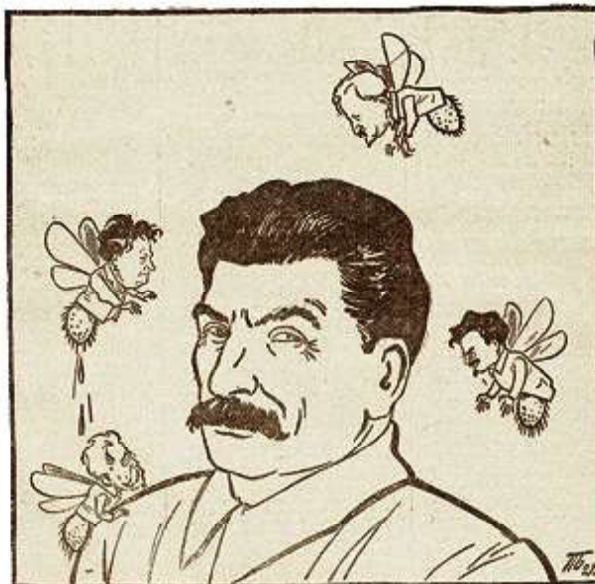
Сталин и надоедливые мухи

«Ленин, вслед за Марксом - продолжает Гачикус, - говорил, что переход от крепостничества к