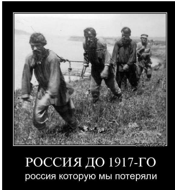
РОССИЯ ДО 1917-ГО россия которую мы потеряли

«Да не слушайте вы их, у нас в полиции Нью-Йорка такой же бардак как во всей Америке! Нас никто не уважает, о нас не заботятся! Вот сюда бы советскую полицию, она бы навела порядок» .