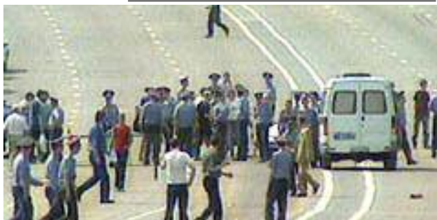
ВЗРЫВ НА КОНЦЕРТЕ В ТУШИНО 05.07.2003

И, наоборот, Олимпийские игры на территории рыночных стран ВСЕГДА сопровождались гигантскими охранными мерами и, тем не менее, практически всегда были омрачены гибелью