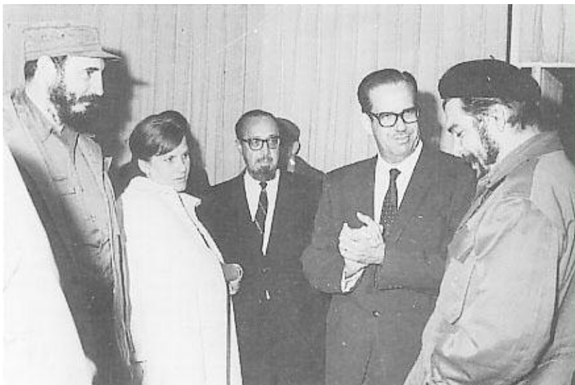
Возвращение Че Гевары из Алжира на Кубу

в эру атомной энергии и автома-тики. Это был бы путь громадных и, по большей ча-сти, бессмыслен-ных жертв. Мы должны начитать с современного технологическо-го уровня. Мы должны совер-шить огромный технологический рывок, который сократит сегод-няшний разрыв между более раз-витыми странами и нами. Техноло-