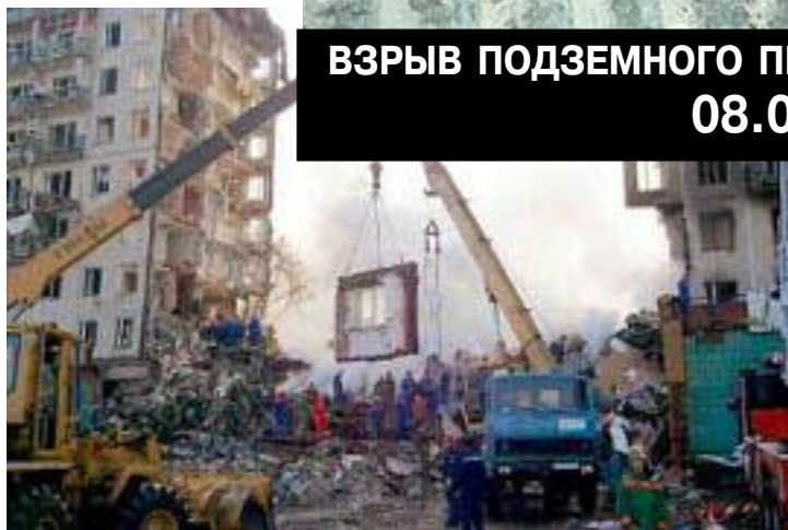
ВЗРЫВ ДОМА НА КАШИРСКОМ ШОССЕ 13.09.1999