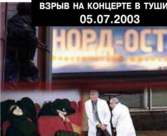
ЗАХВАТ ЗАЛОЖНИКОВ НА ДУБРОВКЕ 23 - 26.10.2002