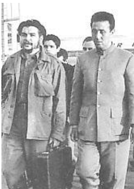
Че Гевара и Бен Белла

лишь изредка продавала сахар некоторым странам социалистического блока, обычно через английских брокеров или брокеров других национальностей. Сегодня же, 80% кубинской торговли составляет торговлю с этим регионом. Все жизненно важные поставки на Кубу идут из соцлагеря, она, фактически, вошла в него. Неверно было бы сказать, что вхождение в лагерь социализма обусловлено просто увеличением торгового оборота, как такового. Как неверно и то, что увеличение торгового оборота обусловлено лишь разрушением старых структур и переходом на социалистический путь развития. Обе стороны этого вопроса неразделимы и взаимосвязаны.