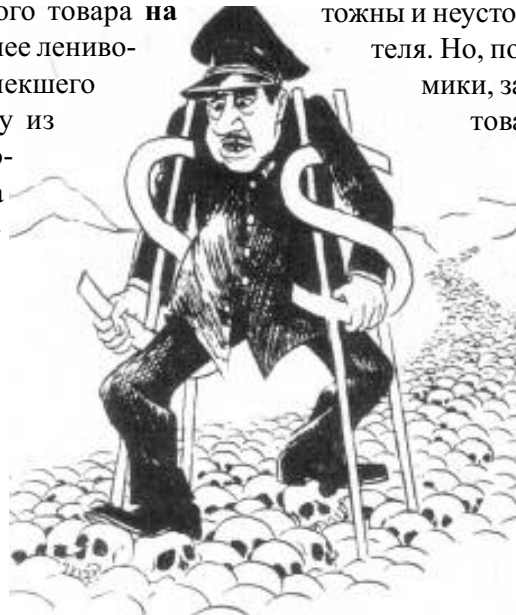
Буржуазное государство на службе олигархии

Однако монополист считал бы себя неудачником, если бы на меньшее количество одного натурального продукта он выменял бы многократно большее количество другого натурального продукта. Например, куриных яиц. Даже самый разнузданный стяжатель понимает всю бессмысленность богатства в виде смердящих миллиардов куриных яиц, и даже миллионов экземпляров «Архипелага ГУЛАГ» Солженицына.