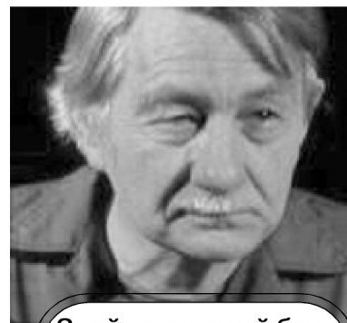
Злой мышинный бог - Джон Кэлхун

странить его выводы именно на Западное общество: несдержанность в еде и питии при всяческом воспрепятствовании умственному развитию людей с помощью «болонской системы». С победой капитализма в мире, вся официальная общественная теория вращается вокруг проблемы замораживания общественного прогресса, т.е. торможения массового индивидуального сознания и поэтому, конечно, во многих вопросах со-