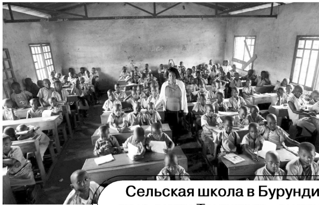
Сельская школа в Бурунди и колледж в Танзании - оцените количество слушателей

ня сельской школы в Бурунди или колледжа в Танзании.