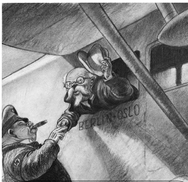
«Берлин-Осло». Серия карикатур «История одного предательства», 1937, посвященных делу Пятакова, художник М.Б. Храпковский

Во-вторых, утверждение, что все советские