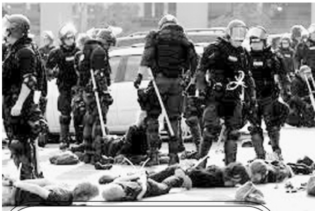
Разгон демонстрации в США.

Никогда не встречал здравомыслящих людей, заучивавших прозу наизусть. Актёры не в счёт. С таким же успехом можно утверждать, что, поскольку эксперименты по столкновению кафельных плиток на столе, не вызывают землетрясения, то и столкновение тектонических плит не может его вызвать. В классной комнате, можно на 50-ти студентах поставить в течение четырёх недель эксперимент по проблеме перенаселенности земного шара и получить вполне успокаивающий результат. Демографического бума в классе за четыре недели не произойдёт, как бы студенты не резвились и, «следова-