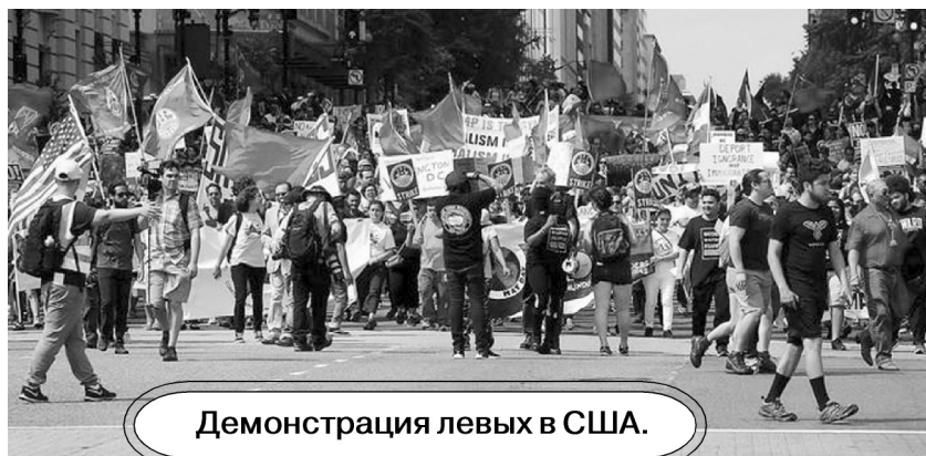
Демонстрация левых в США.

Но, как свидетельствуют данные опроса, проведённого социологической службой YouGov по заказу Фонда памяти жертв коммунизма в октябре 2017 года, граждане США, родившиеся после 1981 года, более негативно воспринимают социальное неравенство в обществе, чем их отцы и матери, старшие братья и сёстры, бабушки и дедушки. Согласно опубликованным данным опроса 44% молодых американцев возрастной группы Millennials (родившиеся в 1980-1990-х годах) предпочли бы жить в капиталистической стране. Поэтому демонстрации под красными знамёнами не такая уже большая редкость и в США.