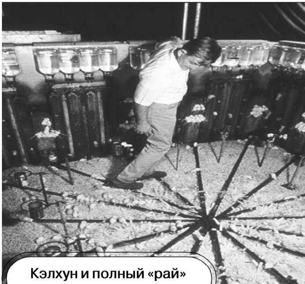
Кэлхун и полный «рай» мышиных трупиков.

ей шкурки. Они питаются гамбургерами, хот-догами, просроченными продуктами, покурявают марихуану, иногда спариваются безразлично с кем и... всё. Вот вам и весь рай... до копейки. - В.П.]