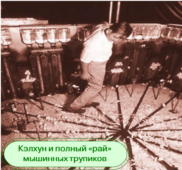
Кэлхун и полный «рай» мышинных трупиков

имеющих средства для поддержания своей шкурки. Они питаются гамбургерами, хот-догами, просроченными продуктами, покуряют марихуану, иногда спариваются безразлично с кем и... всё. Вот вам и весь рай... до копейки. - В.П.]