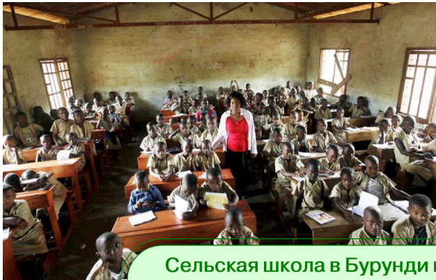
Сельская школа в Бурунди и колледж в Танзании - оцените количество слушателей

ня сельской школы в Бурунди или колледжа в Танзании.