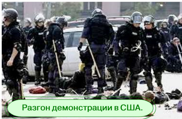
Разгон демонстрации в США.

Однако, как показывает практика, несмотря на то, что современное коммунистическое движение не имеет в своих рядах уже проявивших себя и приобретших широкую известность гениальных литераторов, одинаково хорошо владеющих и диаматикой, и юмором, «эксперименты в классах» и полицейские дубинки оказываются всё более бесполезными в деле дискредитации идей социализма и коммунизма. Недавние социологические опросы, проведённые антикомму-