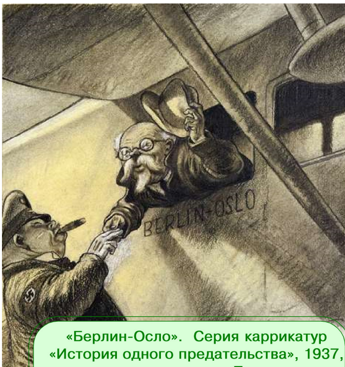
«Берлин-Осло». Серия карикатур «История одного предательства», 1937, посвященных делу Пятакова, художник М.Б. Храпковский

Итак, во-первых, почему Пятаков обязан помнить имя и фамилию, которые были указаны в липовом паспорте? Нет решительно ничего странного в том, что он их не помнил. Впрочем, вполне возможно, что он их помнил и в своих показаниях во время следствия назвал. Но материалы следствия нам пока недоступны. В конце концов, помнил Пятаков эти данные или не помнил, -