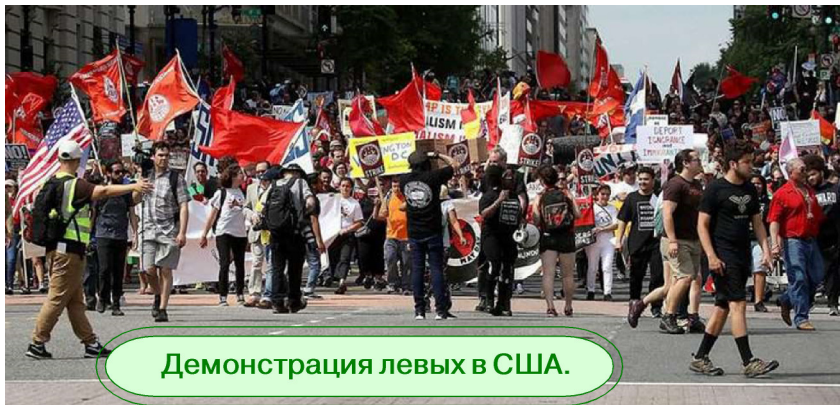
Демонстрация левых в США.

Но, как свидетельствуют данные опроса, проведённого социологической службой YouGov по заказу Фонда памяти жертв коммунизма в октябре 2017 года, граждане США, родившиеся после 1981 года, более негативно воспринимают социальное неравенство в обществе, чем их отцы и матери, старшие братья и сёстры, бабушки и дедушки. Согласно опубликованным данным опроса 44% молодых американцев возрастной группы Millennials (родившиеся в 1980-1990-х годах) предпочли бы жить в социалистической стране. Поэтому демонстрации под красными знамёнами не такая уже большая редкость и в США.