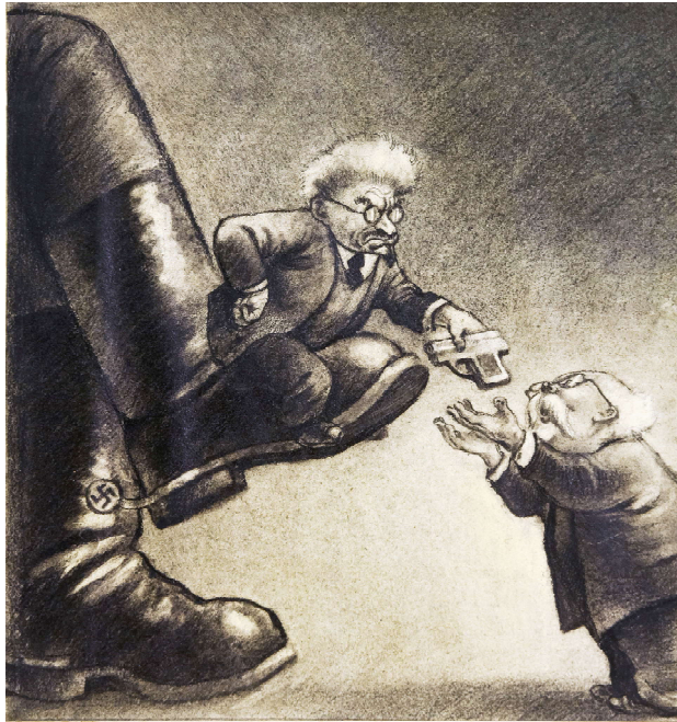
«У вождя». Серия карикатур «История одного предательства», 1937, посвященных делу Пятакова, художник М.Б. Храпковский

зобновлении борьбы против сталинского руководства, что было временное затишье, которое объяснялось отчасти и географическими передвижениями самого Троцкого, но что эта борьба сейчас возобновляется, о чем он, Троцкий, ставит меня в известность.