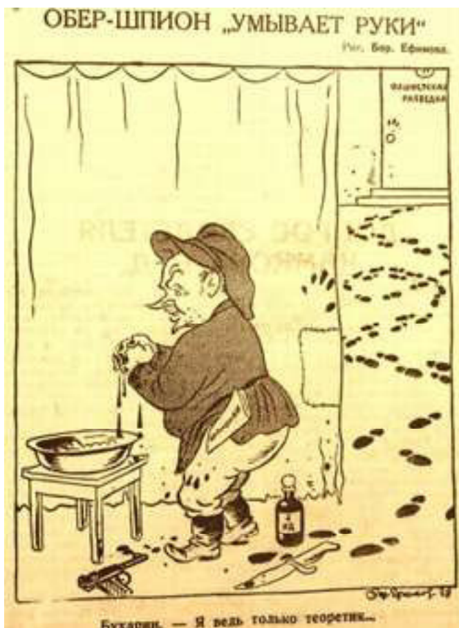
Бухарин. — Я ведь только теоретик...