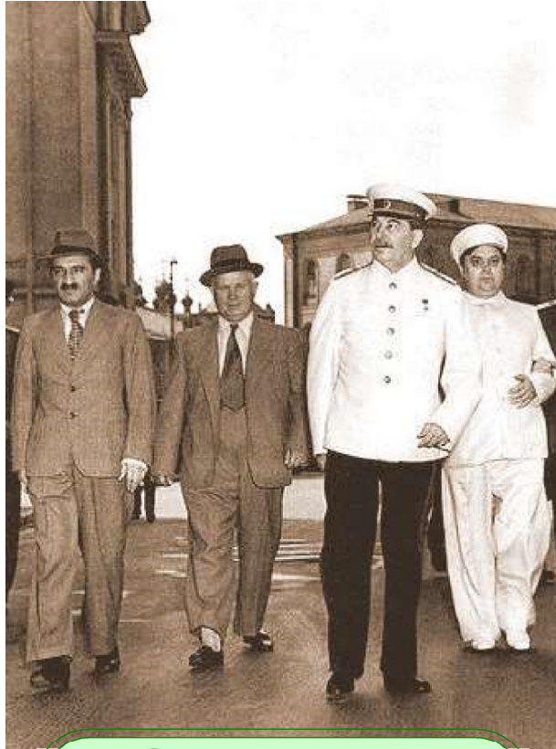
Сталин в окружении подобострастных предателей

«Когда Сталин начал готовить свой предсмертный труд по экономическим проблемам социализма в СССР, он всех заставил читать и изучать его. Буквально вся партия сидела и корпела над этим трудом. [Когда Хрущев написал свою книгу, то даже не все диссиденты и руководители ЦРУ её прочли - В.П.] Он предложил также высказаться ораторам на XIX съезде партии по данному вопросу. Маленков в своем докладе уделил большое внимание его работе. То же сделали и другие выступавшие, за исключением меня. Но я не говорил о нем не потому, что я «смелый и умный» и критически относился к этому труду, а потому, что на съезде я выступал как