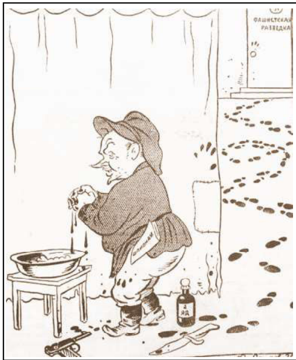
Бухарин: «Я ведь только теоретик...»

ям не убитыми микробами, а живыми, только ослабленными. Поэтому технически организовать искусственное заражение было довольно просто. Во-вторых, потому что по этим двум болезням существует правильный порядок, при котором, в случае заболевания чумой в той или иной местности, подлежит поголовный прививке все, находящееся в этой местности, поголовье свиней. Это давало возможность сразу придать массовый характер этому заболеванию.