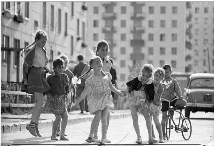
Дети во дворе при социализме и при капитализме

ных и дорогих» районах психи буквально ходят по улицам, орут, устраивают разные «спектакли» и к этому все привыкли». Да, они ходят по улице. Они находятся рядом с университетом, где я работаю. На самом деле, я ожидаю встретить бездомных и психически больных людей каждый раз, когда захожу в офис профсоюза, расположенный на соседней улице. Что безумно в капитализме, так это то, что медицинское учреждение нашего университета находится прямо рядом с этими бездомными и психически больными людьми, но не может им помочь. Другая безумная вещь заключается в том, что у них там часто проходят премьеры фильмов (в Лос-Анджелесе, вы знаете, как это бывает), и вы видите умопомрачительную пропасть в богатстве и полное моральное банкротство всего этого. Представьте себе: бездомные рядом с миллионными актерами и миллиардной индустрией. Молодые женщины с макияжем подбадривают и аплодируют своим любимым звездам рядом с бездомным черно-