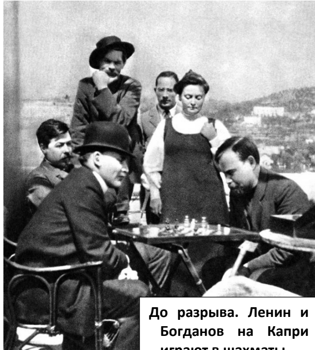
До разрыва. Ленин и Богданов на Капри играют в шахматы.