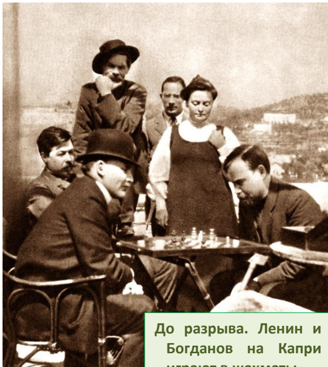
До разрыва. Ленин и Богданов на Капри играют в шахматы.