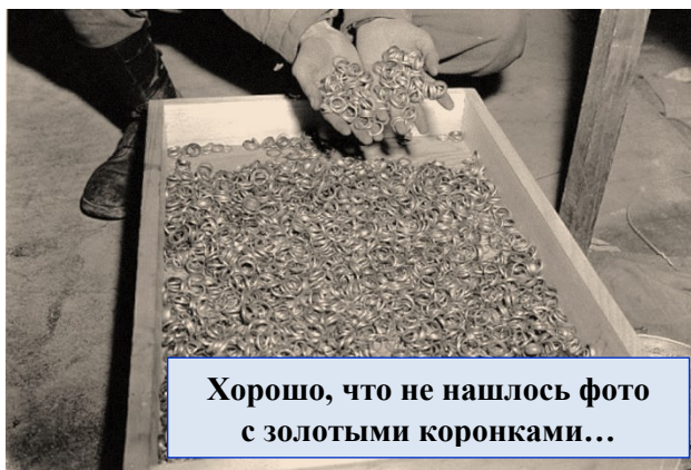
Хорошо, что не нашлось фото с золотыми коронками...

Так о каком действительном нейтралитете Швейцарии можно вести речь, если бы без швейцарских банков, создавших как раз в 1934 году анонимные счета, наши нынешние «уважаемые партнеры» не смогли бы ни накачивать гитлеровскую Германию денежными средствами для ведения войн, ни получить вложенные средства обратно, да еще и с процентами в виде изъятых с трупов в лагерях смерти золотых коронки и обрубчатых колец?